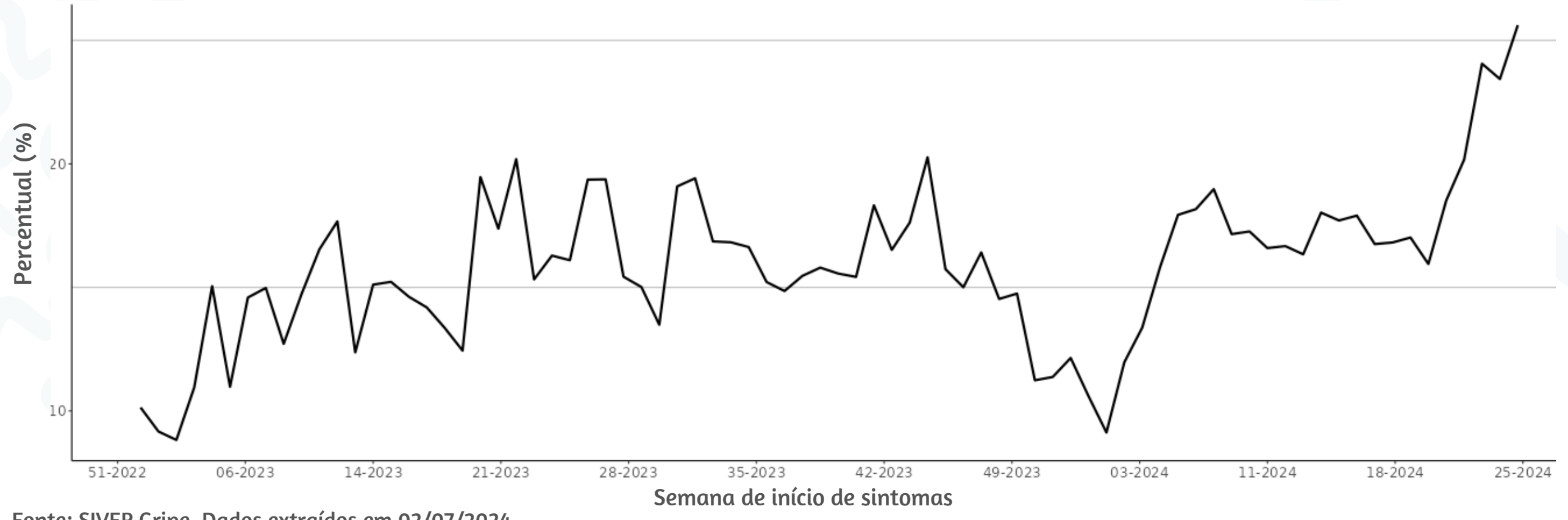
Figura 3. Percentual de atendimentos por Síndrome Gripal(%) em Unidade Sentinela segundo semana epidemiológica de início de sintomas, MSP, 2023 a 2024

Fonte: SIVEP Gripe. Dados extraídos em 02/07/2024.